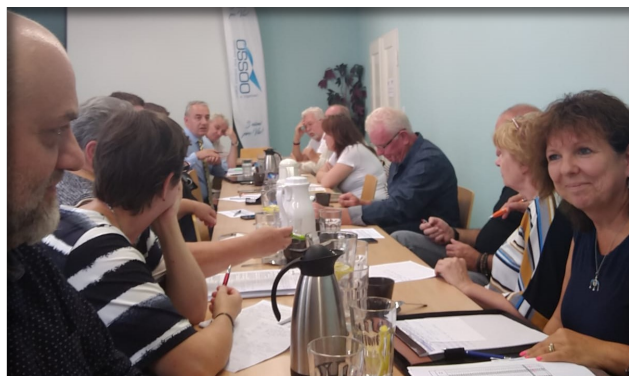
Ilustrační foto z porady zástupců ROPO dne 13. 8. 2019. Hlavním tématem byl postup při vyjednávání o růstu platů ve veřejné správě v roce 2020.

Odpůrci návrhu začnou hovořit o naprostém nedostatku učitelů a o nerealistických představách. Dynamičtější zvyšování platů pedagogů, než je současný vládní návrh o 10%, by zvýraznilo atraktivitu učitelské profese a podpořilo současně nejen ty, kteří jsou za katedrou a uvažují o odchodu, ale i uchazeče o studium a ty, co ze školství odešli. Pak je tu možnost více provázat praxi studentů učitelství ve vyšších ročnících fakult. Jde o nastartování pozitivního procesu a o významnou možnost, jak prohloubit zájem o učitelství.