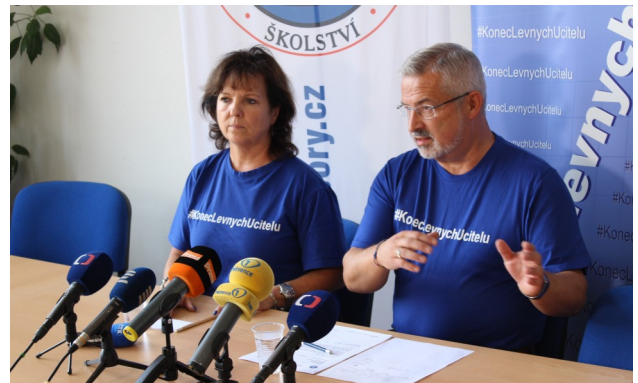
Rozhodnutí o stávce bylo vyhlášeno na brífinku pro média 11. 10. 2019 po jednání předsednictva.

Brífink, na kterém školské odbory vyhlásily svou připravenost ke stávce, se těšil mimořádnému zájmu médií. Odkazy na hlavní mediální výstupy a další informace, včetně dopisů premiérovi a ředitelům škol, naleznete na webu školských odborů zde .