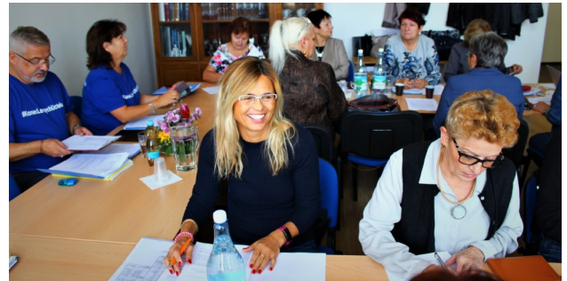
Vyhlášení rozhodnutí o stávce předcházelo jednání předsednictva ČMOS PŠ.

Odbory vyzvaly pracovníky škol k zakládání stávkových výborů, o usnesení předsednictva informovaly ministra školství Roberta Plagu. Byl odeslán dopis ředitelkám a ředitelům škol se žádostí o podporu. Dopisem byl o vzniklé situaci informován premiér Andrej Babiš, vedení svazu ho zároveň požádalo o schůzku za účelem projednání návrhů a požadavků odborů.