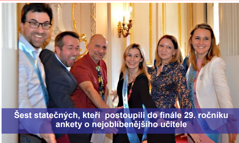
Šest statečných, kteří postoupili do finále 29. ročníku ankety o nejoblíbenějšího učitele