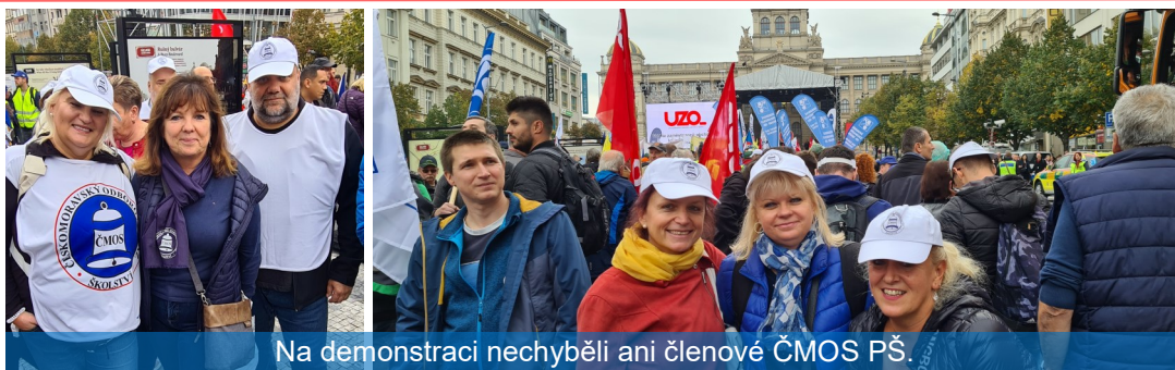
Na demonstraci nechyběli ani členové ČMOS PŠ.