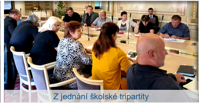
Z jednání školské tripartity