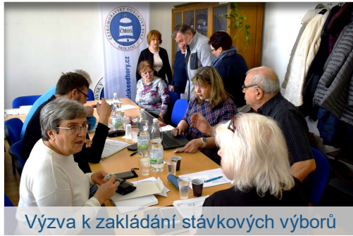
Výzva k zakládání stávkových výborů