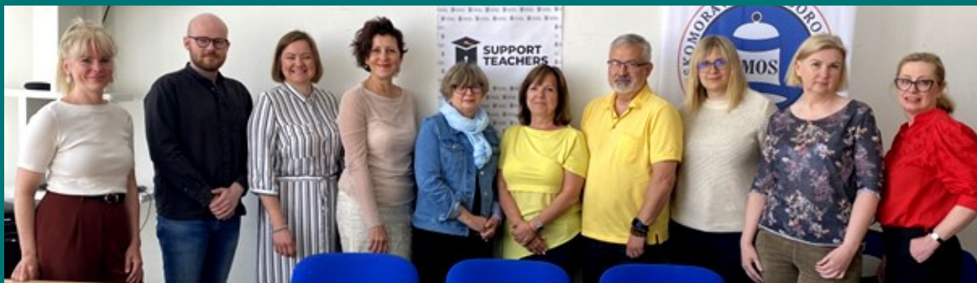
Účastníci setkání partnerů projektu

V květnu 2023 se uskutečnilo v Praze setkání všech partnerů projektu s názvem Vytvoření systému podpory pro začínající učitele. V rámci společného projektu odborové svazy ČMOS PŠ, ZNP (Polsko), LIZDA (Lotyšsko) a LESTU (Litva) na základě dotazníkového šetření a výsledků odborných zpráv vytvářejí elektronickou příručku pro začínající učitele, která má za cíl usnadnit „nováčkům“ vstup do profese a nabídnout další možnosti vzdělávání.