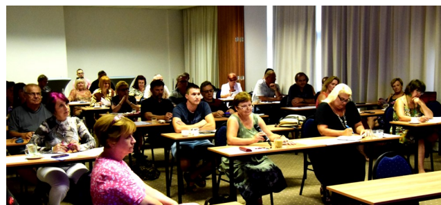
Z porady předsedů oblastních rad a profesních sekcí (hotel Olšanka Praha, 23. 8. 2023).