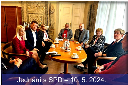
Jednání s SPD – 10. 5. 2024.