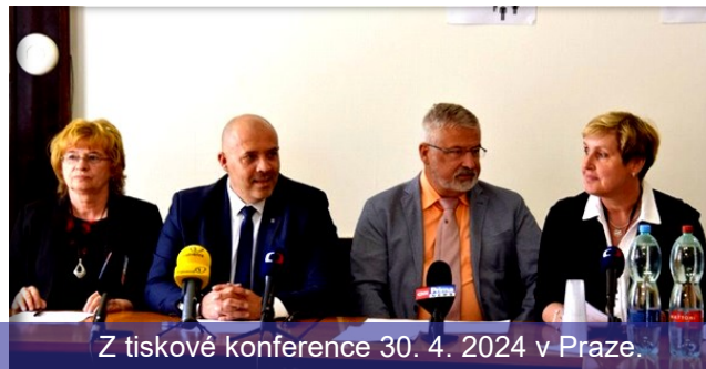
Z tiskové konference 30. 4. 2024 v Praze.