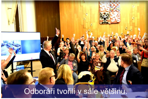
Odboráři tvořili v sále většinu.