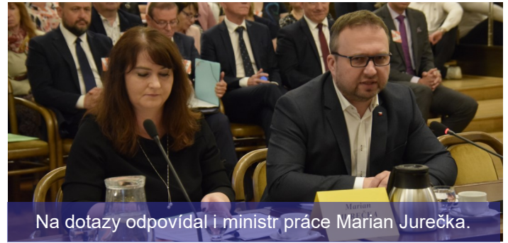
Na dotazy odpovídal i ministr práce Marian Jurečka.