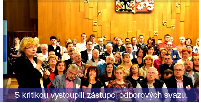
S kritikou vystoupili zástupci odborových svazů.