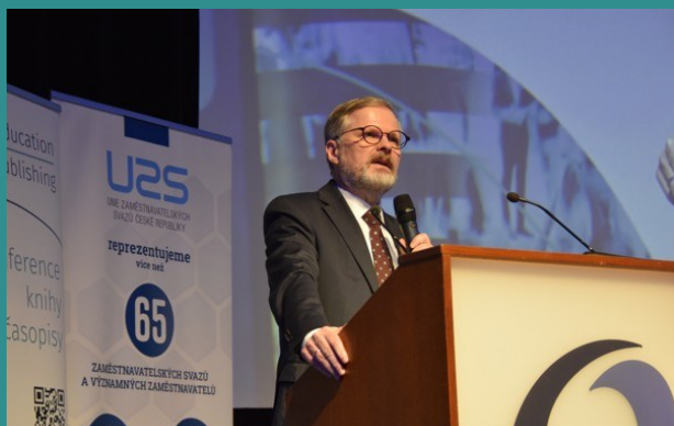
Premiér Petr Fiala vystoupil počátkem prosince 2024 na konferenci Školství 2025 v Praze

Premiér Petr Fiala odpálil společenskou rozbušku. V čase, kdy se jeho vláda ve všech průzkumech dostává na velmi nízkou úroveň důvěry, slíbil, že pokud dostane šanci na další volební období, pozvedne české mzdy a platy na úroveň Německa.