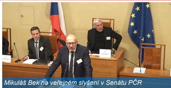
Mikuláš Bek na veřejném slyšení v Senátu PČR