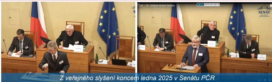
Z veřejného slyšení koncem ledna 2025 v Senátu PČR