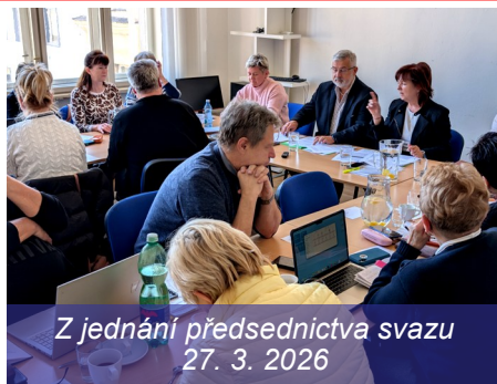
Z jednání předsednictva svazu 27. 3. 2026